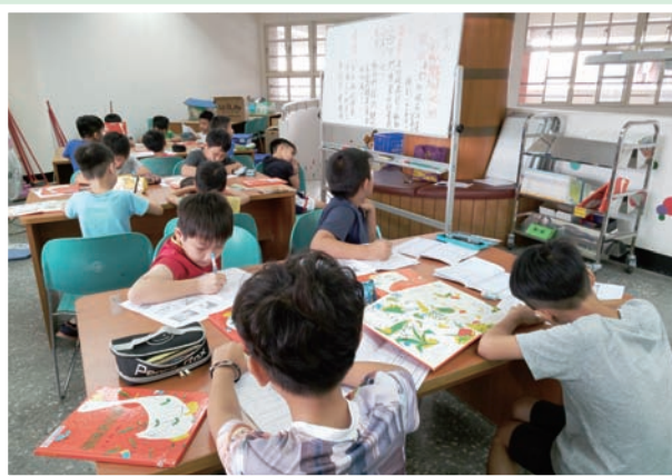
透過共讀，大家一起愛上閱讀。

當時的我包辦三到六年級的閱讀課，合計17個班級，要針對閱讀習慣與興趣不同的學生進行閱讀指導，確實不容易。幸好認識了「愛的書庫」，就像吃了一顆定心丸似的，它讓我沒有後顧之憂，滿滿的金山寶庫，不用擔心無書可用。我開始嘗試在閱讀課中，用書庫提供的共讀書箱，指導學生撰寫心得與摘錄佳句，也透過師生共讀，指導學生重述故事與提取訊息，習慣養成後，美好的閱讀氛圍自然形成，幾個學期過去了，我開始能窺見學生們「愛上閱讀」的美好風景。