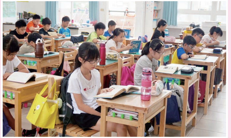
早自修，每個人安靜地閱讀，幫助心情沉澱，使一天的學習更有效率。