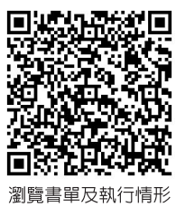
瀏覽書單及執行情形

為滿足老師有更多好書可以搭配課程運用，本會蒐集師生強力推薦的願望書單共144種，感謝企業團體、校園師生及個人愛心支持，募款計畫圓滿達標！144個全新的共讀書箱已陸續上架至「愛的書庫」，快點來借唷！