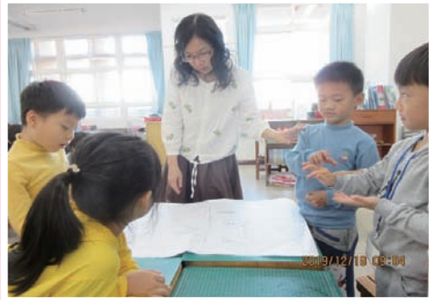
大量閱讀讓學生開啓多元視野。

大量閱讀是我的一貫閱讀策略。早自修配合學校活動採用靜默式閱讀；其中每週兩次由書香媽媽帶繪本導讀，讓孩子學會逐字讀繪本，強化拼音能力。老師利用學校套書、「愛的書庫」箱書於閱讀課時引導孩子故事深究；利用戲劇的角色扮演讓孩子融入情境，體會故事內容。鼓勵學生每天借閱教室圖書、圖書室的故事書；並配合輔導室及圖書館活動進行主題閱讀。