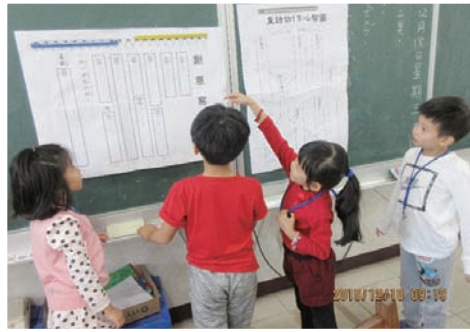
由童詩入門，從唸讀、精讀到創作、展現！