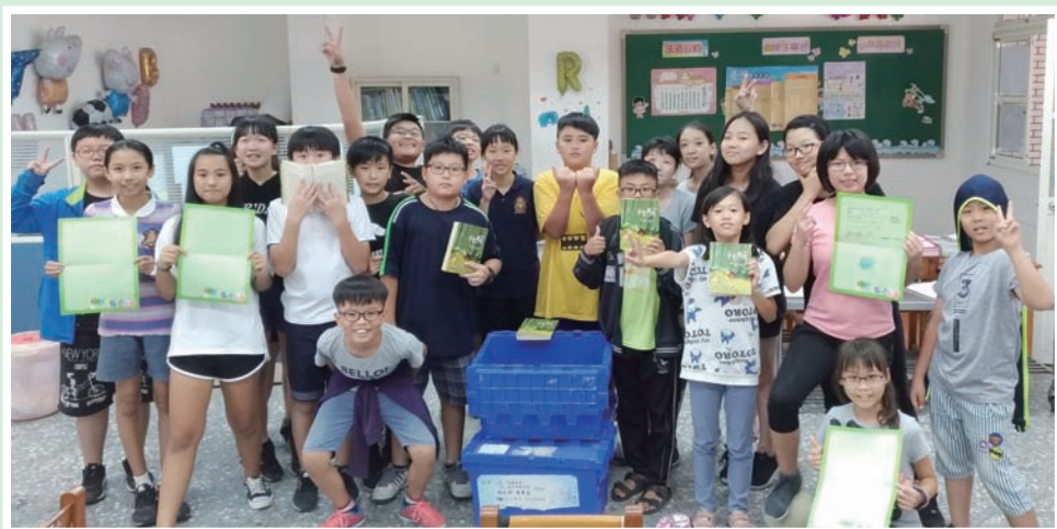
閱讀種子已然萌芽，有朝一日將遍地開花。

未來我們期許孩子們除了愛閱讀，也能多元閱讀，進而有自主學習的能力，跟上時代的腳步。盼望在競爭如此激烈的世代裡，我們依然能確實落實「十年樹木、百年樹人」的教育初衷，讓種下希望的種子有朝一日遍地開花，讓校園因閱讀而處處飄香。