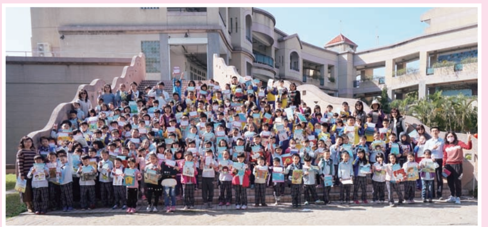
嘉義市育人國小參與「寫十贈一」活動，大家都換到自己喜歡的書，成果豐碩。

「寫十贈一」讓我們愛上閱讀，還可以跟一到六年級的小朋友拍照喔！這個活動不僅有趣還可以得到書，真是一舉兩得呀！