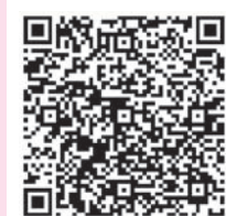
我要參加 「感謝卡傳情」活動

親愛的埔里國小五年五班小朋友們，收到你們所寄過來的卡片了，看到你們手上拿著從「愛的書庫」所借的書，還有臉上燦爛的笑容，我也不禁開心地笑了！要繼續借書，看書喔！Give me five！