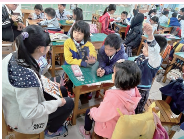
高年級為低年級說故事，大家聽得好認真。

它讓我得到非常多書，也讓我愛上看書，透過閱讀和寫作，讓我可以練習閱讀理解策略及提升寫作能力，有很多益處，期待下次的「寫十贈一」。