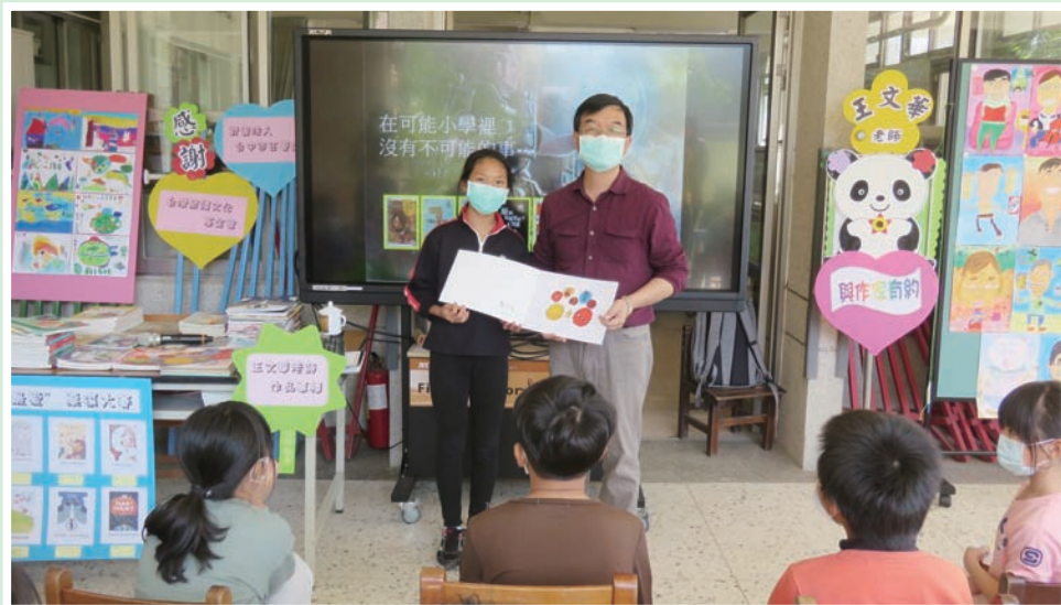
感謝老師的分享與啟發，學生致贈自己創作的繪本（後寮國小）。