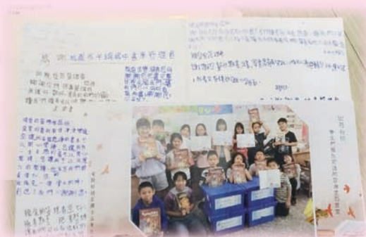
南投縣埔里國小熱情參與感謝卡傳情活動。

親愛的管理者您好，謝謝您用心地幫大家維護書箱，收書、點書，讓我們大家有乾淨的書可以讀，您辛苦了！（以上為內容節錄）