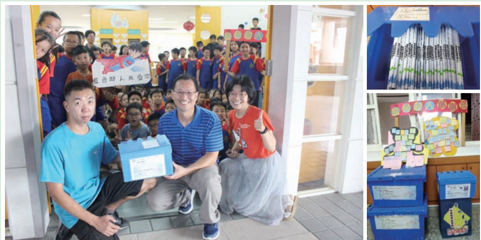
師生仿作小型的共讀書箱，致贈藍色超人，箱內還有袖珍小書呢！

等，讓學生們在享受書庫提供的寶貴資源後，也懂得感恩。另類教師節時，我們特別仿作了一個小型的「愛的書庫」書箱，要致贈給藍色超人，感謝他常常幫忙搬運厚重的書箱，卻總是不喊累。當藍色超人現身與我們合照的那一刻，我的內心有滿溢的感動，覺得推廣閱讀這件事真是太有意義了！